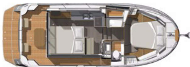
1 Каюта - Раздельная душевая